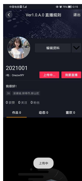
图 1-3-2-4 直播结束界面