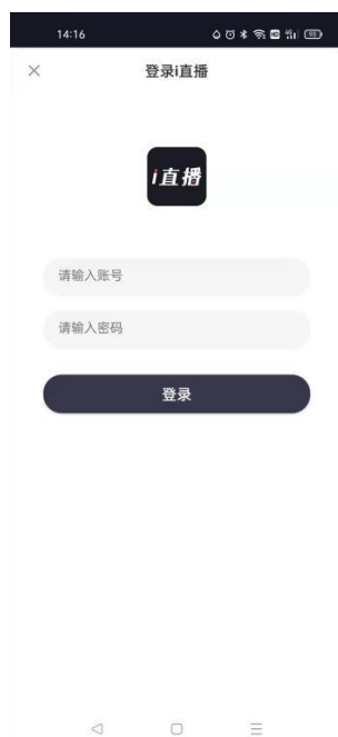
图 1-2-2 登录 i 直播页面

在图 1-2-1 App 端首页中，单击“我”，页面跳转至登录 i 直播页面，如图 1-2-2 所示：