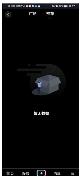
图 1-2-1 App 端首页

在图 1-2-1 App 端首页中，单击“我”，页面跳转至登录 i 直播页面，如图 1-2-2 所示：