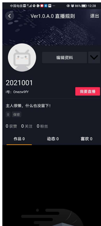
图 1-3-1 个人中心页面