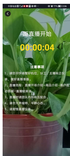
图 1-3-2-1 直播开始倒计时页面

在图 1-3-1 个人中心页面中，单击“我要直播”按钮，系统进入距直播开始倒计时页面，如图 1-3-2-1 所示：