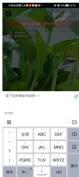
图 1-3-2-3 留言输入框页面

在图 1-3-2-2 中，单击“和粉丝说几句吧”输入框，系统弹出留言输入框，如图 1-3-2-3 所示：